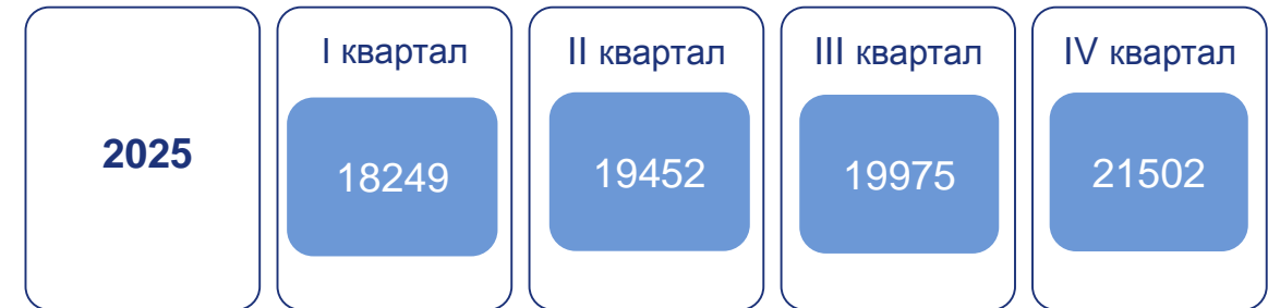
Середньомісячна заробітна плата штатних працівників за статтю, грн