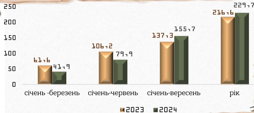
Загальна площа житлових будинків, прийнятих в експлуатацію (тис.м 2 загальної площі)