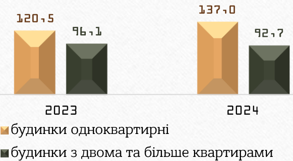
Загальна площа житлових будинків, прийнятих в експлуатацію, за видами (тис.м 2 загальної площі)