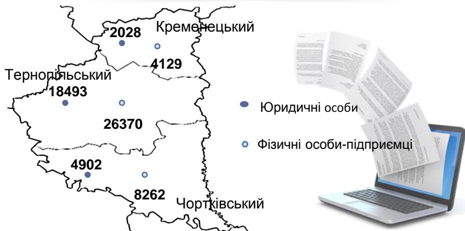
РОЗПОДІЛ ЗАРЕЄСТРОВАНИХ СУБ'ЄКТІВ ГОСПОДАРЮВАННЯ ПО РАЙОНАХ (одиниць)