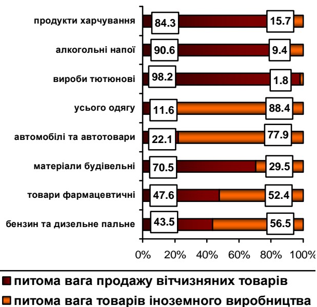
Питома вага продажу вітчизняних товарів у роздрібній торговій мережі

Частка оптової торгівлі товарами виробництва України порівняно з 2012р. зменшилась на 2,0 в.п. і склала 86,6% загального обсягу продажу, або 16981,7 млн.грн.