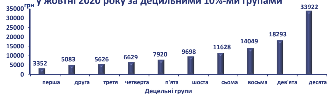
Рівень середньої заробітної плати штатних працівників у жовтні 2020 року за децильними 10%-ми групами

Примітка. За матеріалами вибіркового обстеження "Рівень заробітної плати працівників за статтю, віком, освітою та професійними групами", згідно даних ф.№ 7-ПВ (один раз на чотири роки) "Звіт про заробітну плату за професіями окремих працівників".